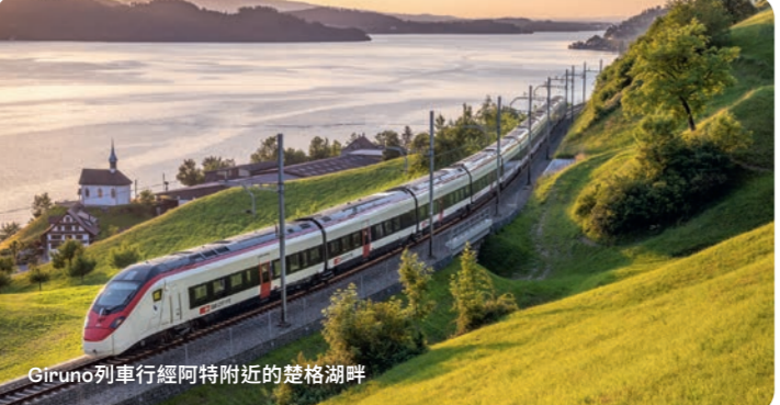
Giruno 列車行經阿特附近的楚格湖畔