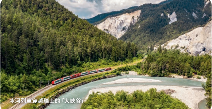
冰河列車穿過瑞士的「大峽谷」