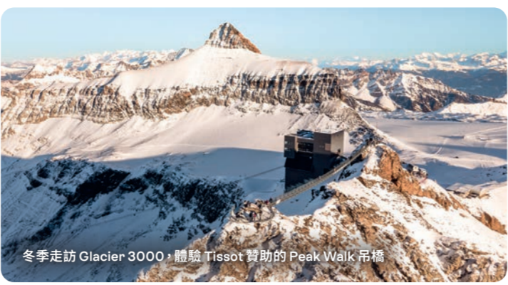
冬季走訪 Glacier 3000，體驗 Tissot 贊助的 Peak Walk 吊橋