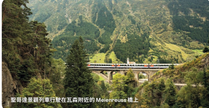
取哥邊景觀列車行駛在瓦森附近的 Meienrouss 橋上