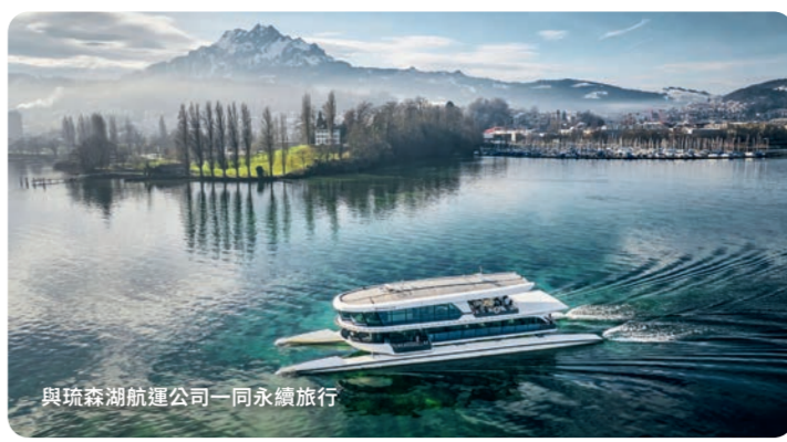
與琉森湖航運公司一同永續旅行