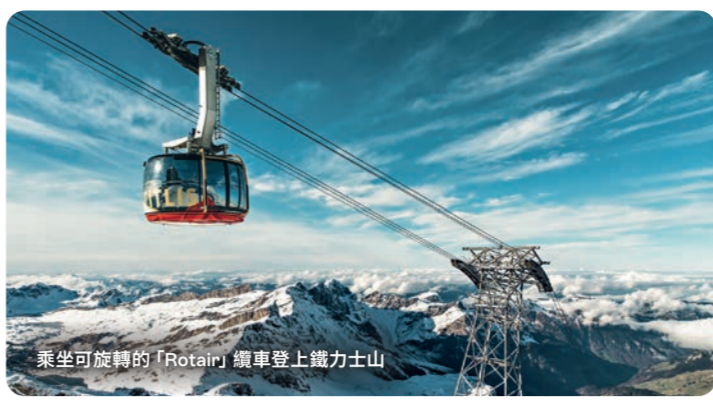
乘坐可旋轉的「Rotair」纜車登上維力山