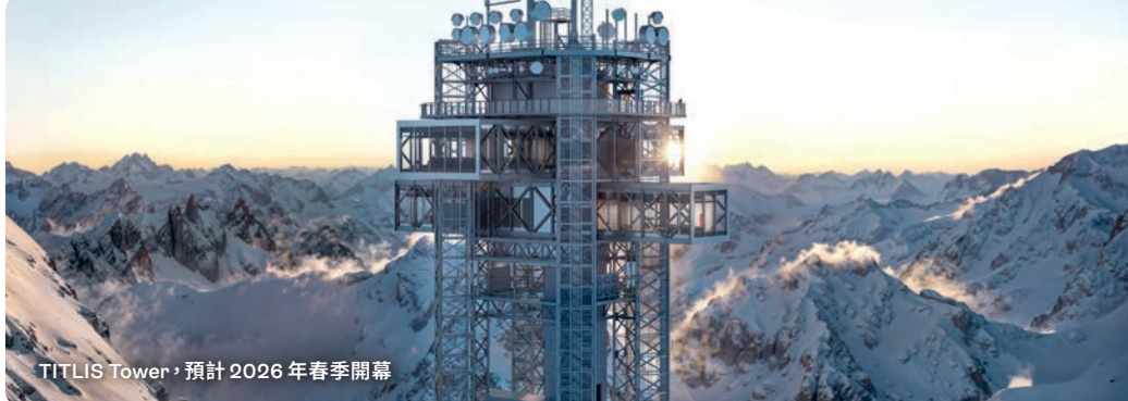
TITLIS Tower，預計 2026 年春季開幕