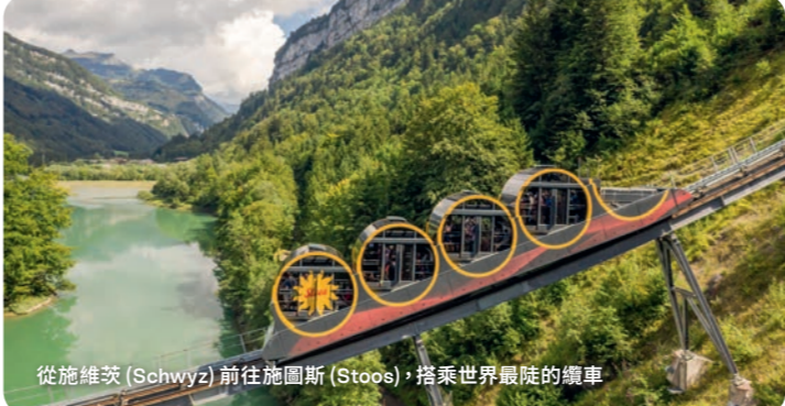
從施維茨(Schwyz)前往施圖斯(Stoos)，搭乘世界最陡的纜車