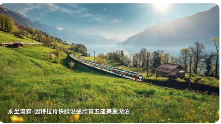
乘坐琉森-因特拉肯快線沿途欣賞五座美麗湖泊