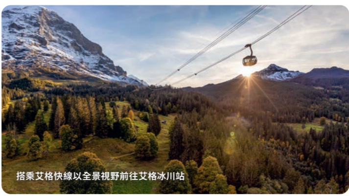
搭乘艾格快線以全景視野前往艾格冰川站