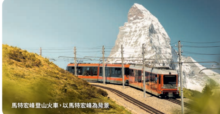
馬特宏峰登山火車，以馬特宏峰為背景