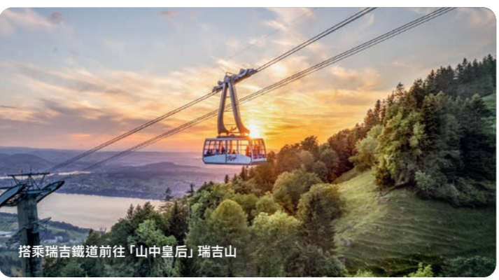
搭乘瑞吉鐵道前往「山中皇后」瑞吉山