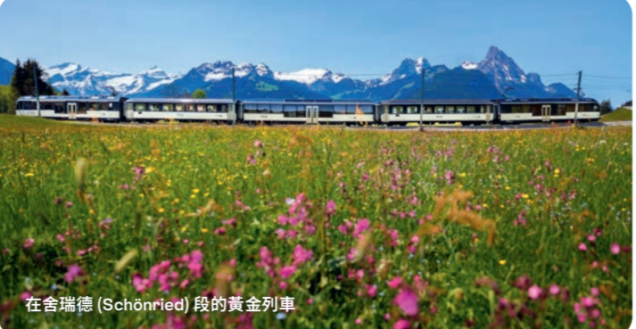
在舍福德(Schönried)段的黃金列車