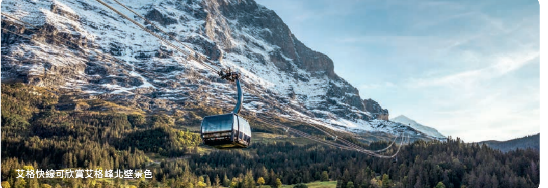
艾格快線可欣賞艾格峰北翼景色